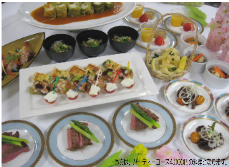
写真は、パーティーコース4,000円の料理となります。