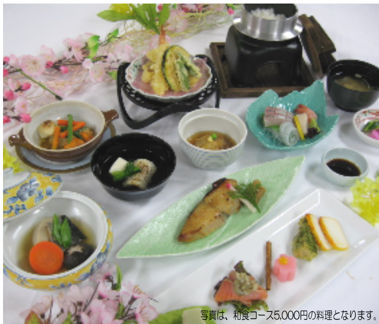
写真は、和食コース5,000円の料理となります。